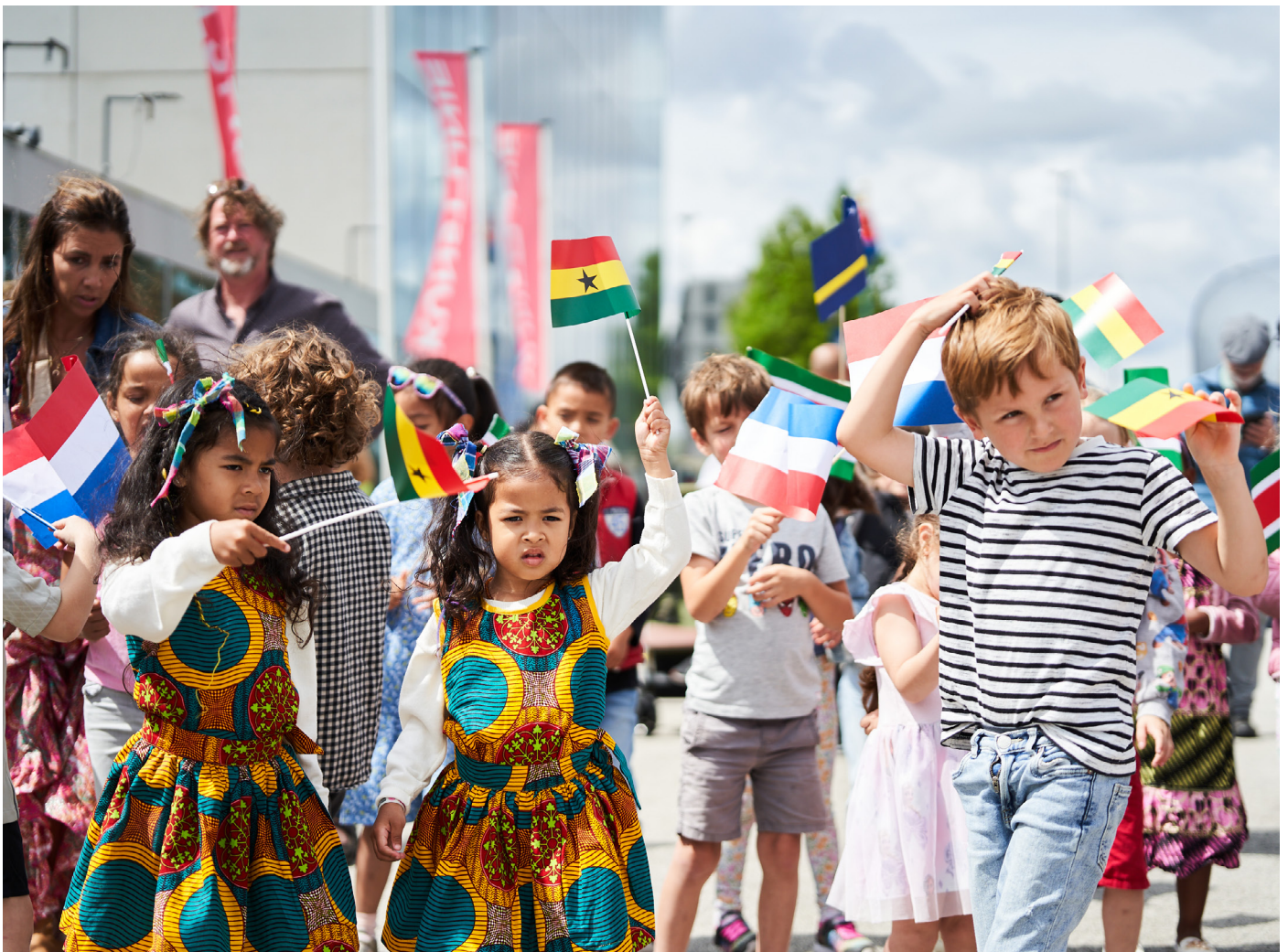
Keti Koti Kidsparade 2024

Vanaf september 2025 starten we een samenwerking met Kleur in Cultuur, een organisatie die kunst en cultuur toegankelijk maakt voor alle Almeerse kinderen van 7 t/m 12 jaar. Kleur in