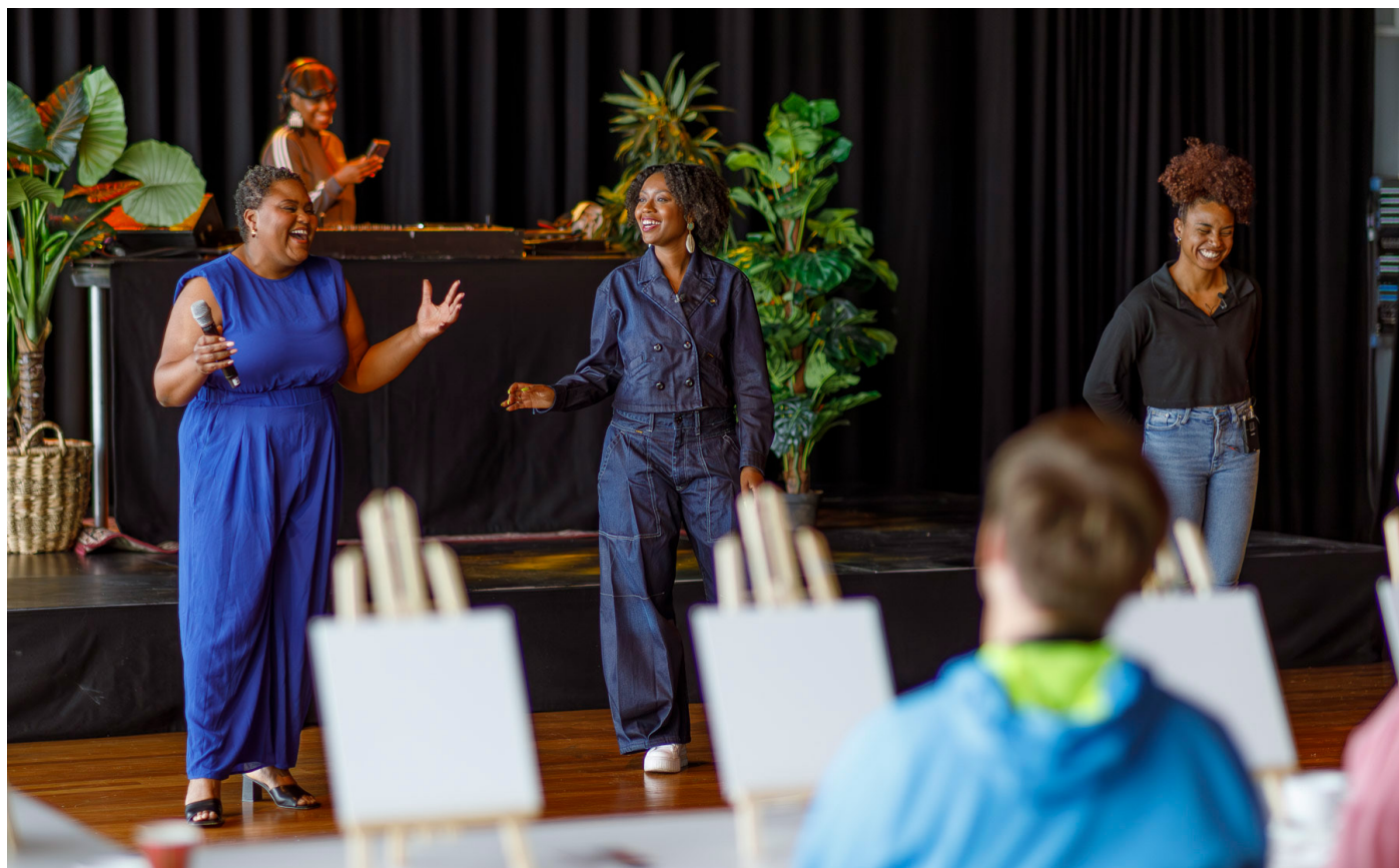
Black Achievement Month 2024